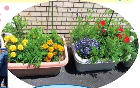
民生委員の皆さん 手慣れてます!!