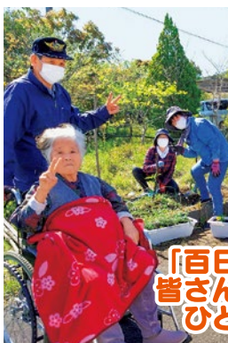
「百日紅の家」 皆さんと笑顔の ひととき♪

~社会福祉センター・百日紅の家を訪れた際は、 満開の花々を楽しんでいただけると嬉しいです♪~